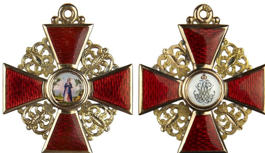
Рис. 1. Знак ордена Св. Анны 3-й степени

В отставку С.Ф. Зенович вышел в 1839 г. в чине надворного советника, после чего проживал в Киеве и Кременце. Умер в 1856 г. Современники отзывались о нем как о человеке уважаемом, кротком и общительном. Известно об одном исследовании С.Ф. Зеновича – «О необходимости изменения общих оснований наук, всех теорий и систем» (1837 г.), которое так и не было опубликовано (автор не получил официального разрешения из Императорской Академии Наук) [11, с. 206-207].