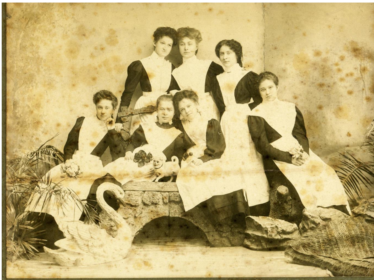
Рис. 2. Гимназистки. Фото 1909 г.

Данное положение не шло ни в какое сравнение с быстро растущими в годы реформ потребностями женского образования в регионе и требовало немедленного вмешательства со стороны общественности. Идея преобразования училища в прогимназию вызрела довольно быстро и обнаружила поддержку со стороны уездного земства. Именно благодаря его ходатайству «и с согласия г. попечителя Харьковского учебного округа» в 1870 г. в Сумах на основе училища была открыта женская прогимназия, преобразованная, наконец, через три года по инициативе городского головы И.Г. Харитоненко в полное среднее учебное заведение (в 1873-1907 гг. – Сумская женская гимназия; в 1907-1919 гг. – Сумская I-я женская гимназия). Земская инициатива было подкреплена финансовыми обязательствами. В прошении Харьковскому губернскому земскому собранию в 1869 г. сумяне обязались направить на строительство здания гимназии 20 тыс. руб. уездных сумм и оповестили о сборе еще 15 тыс. руб. частных пожертвований [48, с. 253; 60, с. 9; 64, стлб. 1076-1077; 75, с. 199].