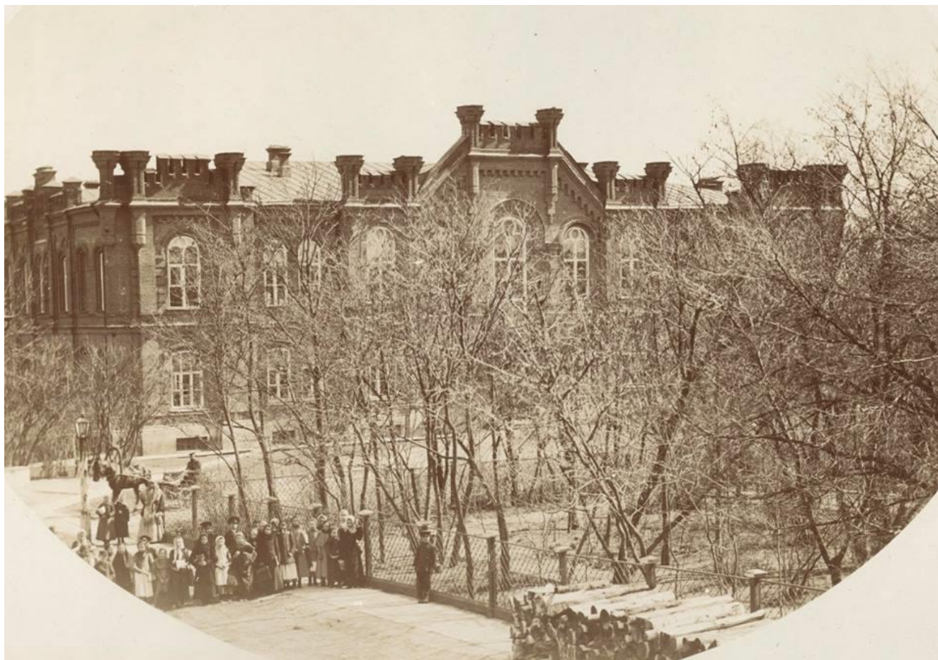
Рис. 1. Сумская женская гимназия

Однако, для города с населением более чем в 13 тыс. жителей численность учащихся школы оказалось ничтожно малой по сравнению с задачами массового просвещения. Так, в 1866 г. Всего в Сумах насчитывалось 504 учащихся обоего пола (1 на 31 жителя города или 3,12 % от всего населения), а в уезде – 1493 чел. или 1,38 % от всего населения. Даже на фоне