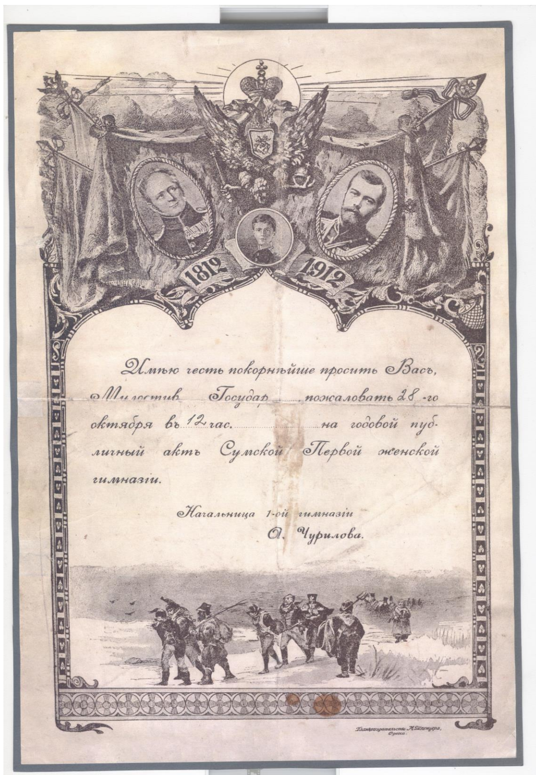
Рис. 4. Приглашение на годовой публичный акт. 1912 г.

Несмотря на замораживание роста жалования части работников гимназии, эта часть бюджета по-прежнему занимала большую часть ее расходов, хотя и постепенно уменьшалась в коэффициенте с другими затратными суммами. Так, в 1877-1878 у. г. в фонд заработной платы учителям отчислялось 86,75% бюджета, 1895-1896 у. г. – 81,83%, а в 1906 г. – 65,8%. Вместе с тем увеличивалась доля оплаты труда технического персонала (за 1877-1913 гг. с