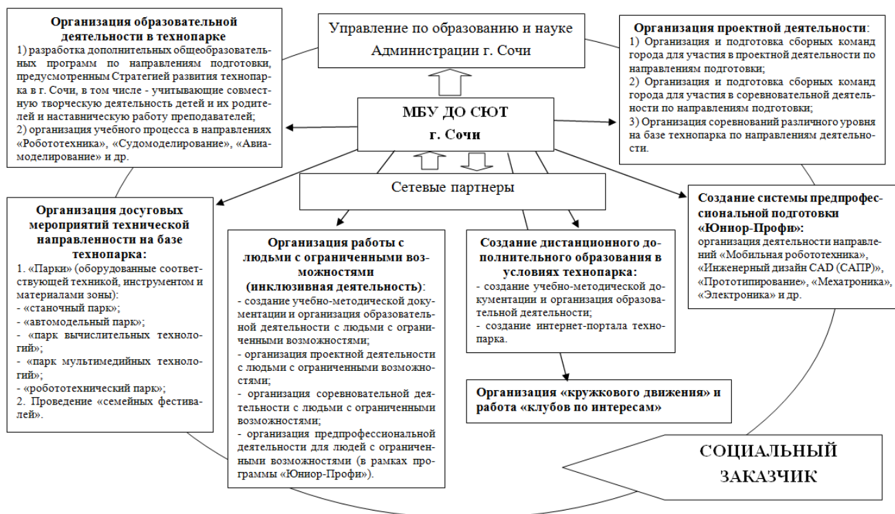
Рис. 1. Общая схема функционирования технопарка в г. Сочи

Как было указано выше, в Сочи отсутствует специализированная зона, которая предоставляла бы возможность сочетания «технологического образования» и «технологического досуга». При этом, построение технопарка на базе МБУ ДО СЮТ в г. Сочи, по нашему мнению, может иметь определенные преимущества. Во-первых, это наличие квалифицированного кадрового состава, способного к непрерывному образованию (педагоги соответствующих технических направлений). Во-вторых, – наличие материальной базы (имеющиеся в наличии инструменты, модели, конструкторы, материалы для их изготовления и т.п.) и территории для организации площадок Технопарка.