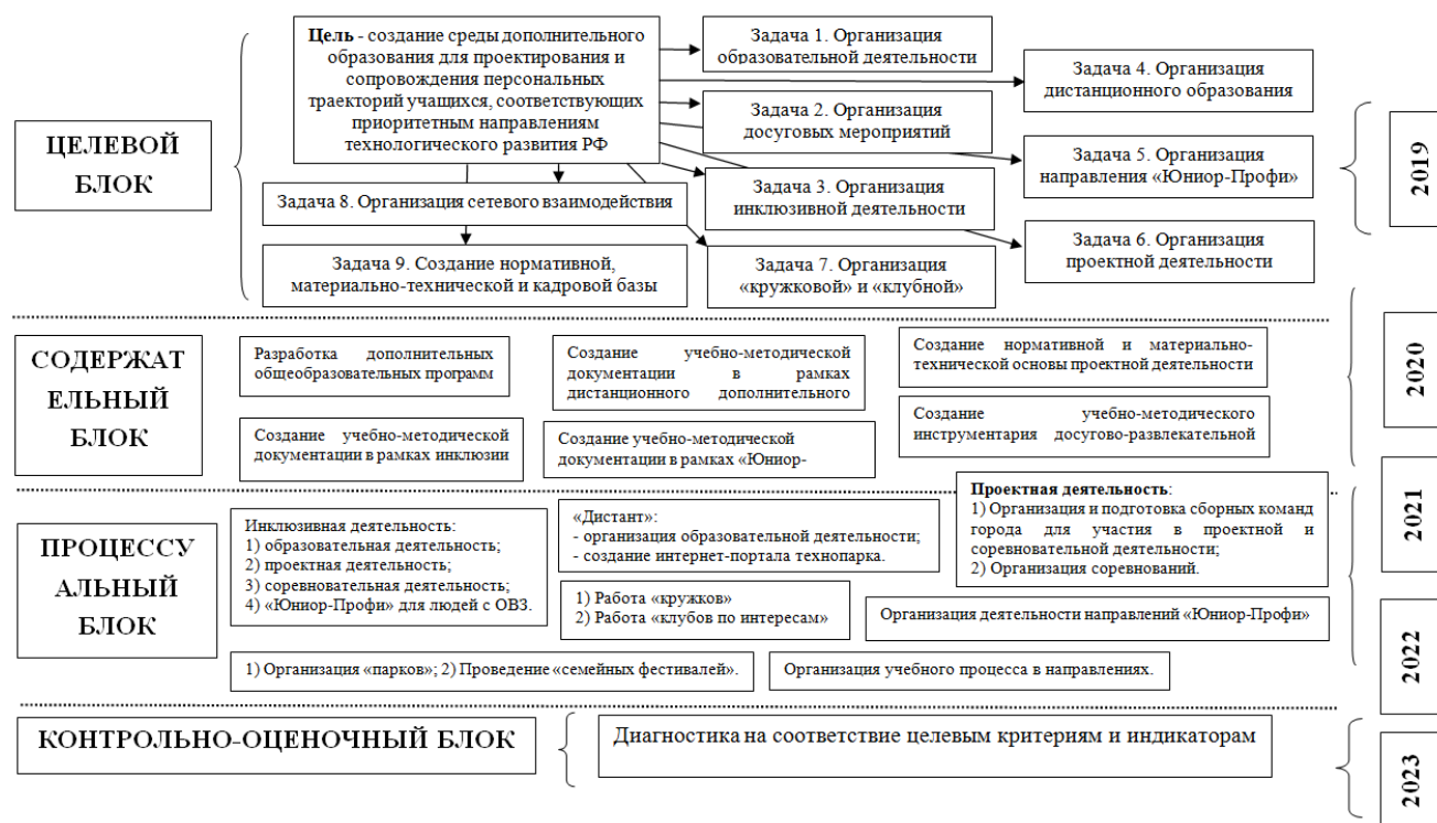
Рис. 2. Схематическая модель технопарка в г. Сочи

Модель-схема процесса создания технопарка в г. Сочи на базе СЮТ изображена на Рисунке 2 .